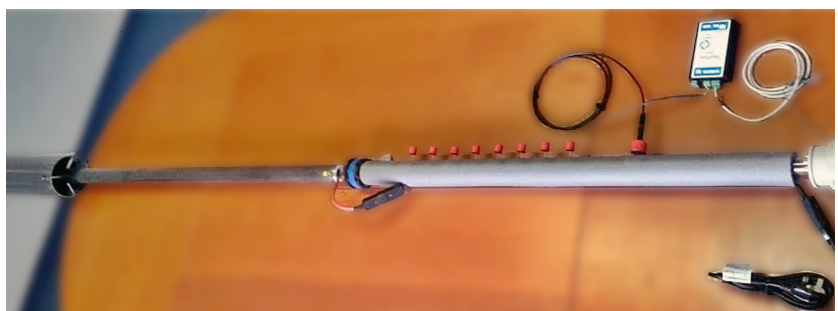
RegFlow a vzorkovací systém